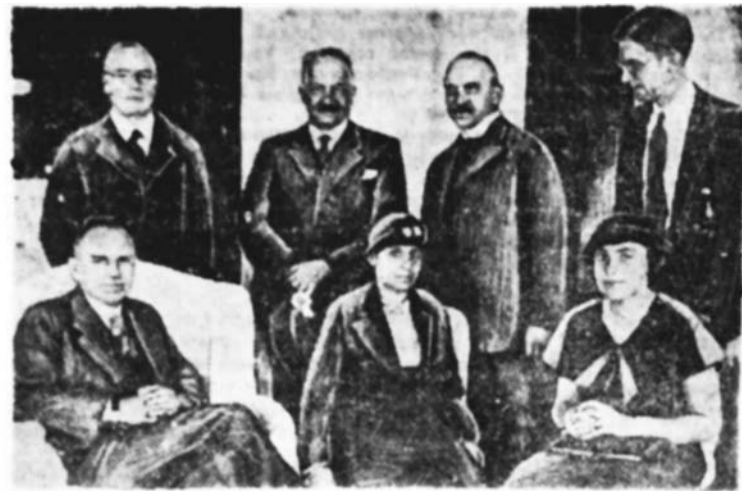
Группа иностранных ученых, прибывших на Менделеевский съезд. Сидят: профессора Германии ГАН (слева), МЕЙТНЕР (в центре). Стоят ВАЛЬДЕН, БИЛЬЦ и др.