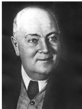
Академик Александр Евгеньевич Ферсман

Ферсман, поэт камня, как его называли. Он очень любил Урал, часто бывал на Ильменах, возглавлял радиевую экспедицию. В Академии за его энергию и за соответствующий вид его называли также «шаровая молния». Он очень энергично взялся за дело, действительно хотел создать на Урале нечто выдающееся, чему до этого аналогов не было. И в первых постановлениях идет: то станция создается, то база, то филиал, а в постановлении Губкома (Уральского Обкома) написано: «Создать отделение из 11 институтов». Это потом обозначились все этапы и ступени подразделений Академии. Вот отрывок из письма Ферсмана: «Мне хочется мыслить на Урале об Академии наук и техники, где могли становиться и решаться большие проблемы научных основ овладения Урала. Пока что я не знаю, как это, я не знаю, как выйти из Академии и связаться с Наркомашпром».