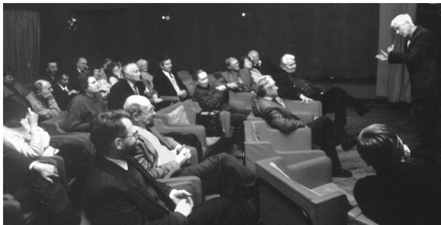
В малом зале Дома кино.

Почему именно этот фильм был предложен вниманию ученых? Чтобы ответить на этот вопрос, придется, хотя бы кратко, рассказать о его содержании. Понятно, что такой пересказ — дело весьма неблагоприятное: кино надо смотреть, что, кстати, мы и рекомендуем нашим читателям. И все-таки, о чем этот фильм?